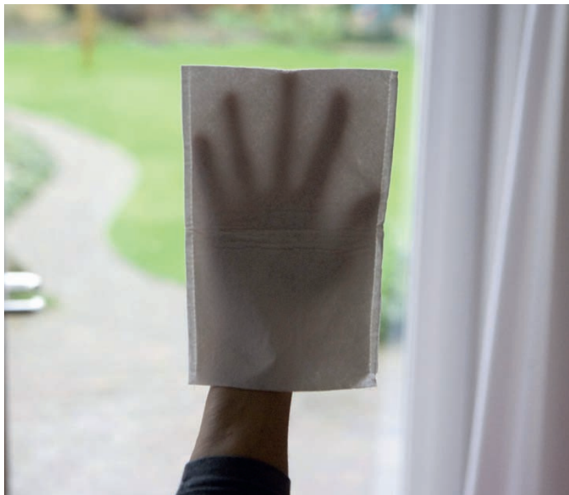
Zo ziet een verzorgend washandje eruit.

laat zien dat verzorgend wassen vooral geschikt is voor mensen die niet meer (regelmatig) kunnen douchen, die pijnklachten hebben of zeer vermoeid zijn. Cliënten en medewerkers geven verzorgend wassen een hoger rapportcijfer dan traditioneel wassen. Positieve punten zijn minder vermoeidheid, minder pijn en jeuk en minder fysieke belasting. Ook houden cliënt en verzorgende